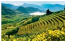
Lago di Caldaro

Skigebieden: De skigebieden Obereggen en Alpe di Siusi/Seiser Alm (samenwerkingsverband Dolomiti Superski), Corno del Renon/Rittnerhorn en Sarentino/Reinswald (samenwerkingsverband Ortler Skiarena) liggen in de omgeving van Bolzano (max. 40 min. rijden).