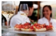
Aperitief op de piazza