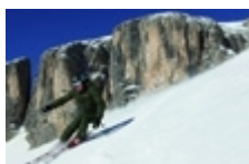
Skiën in de Dolomieten

Alpe di Siusi/Seiser Alm: Tijdens een arrensletocht over de Alpe di Siusi kunt u de grootste alpenweide van Europa (9) comfortabel en warm ingepakt verkennen.