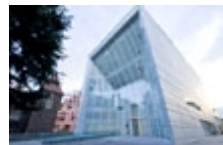
Museion in Bolzano